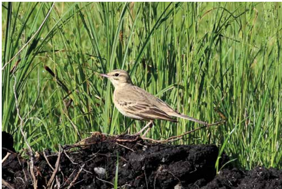
Calandro. Annone - Oggiono (LC). (Enrico Viganò)

11 settembre al Pian di Mezzola (CO-SO) 1 ind (An. Nava e Al. Nava)