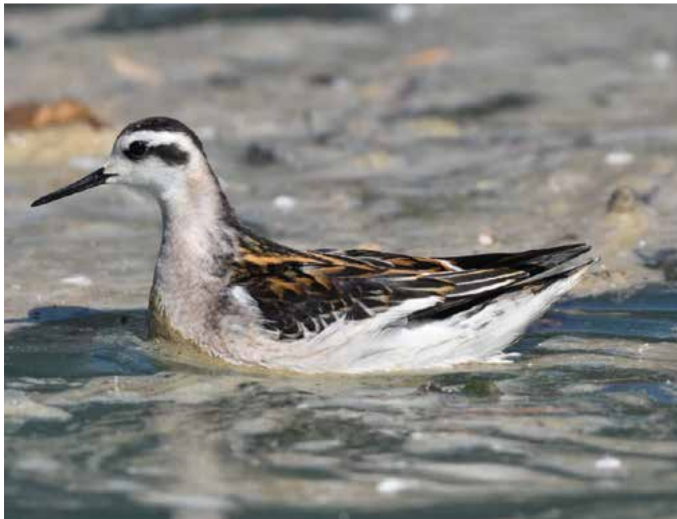
Falaropo beccosottile. Foce Adda (CO-LC).

dal 29 agosto al 1° settembre a Foce Adda (CO-LC) 1 ind (An. Nava e Al. Nava)