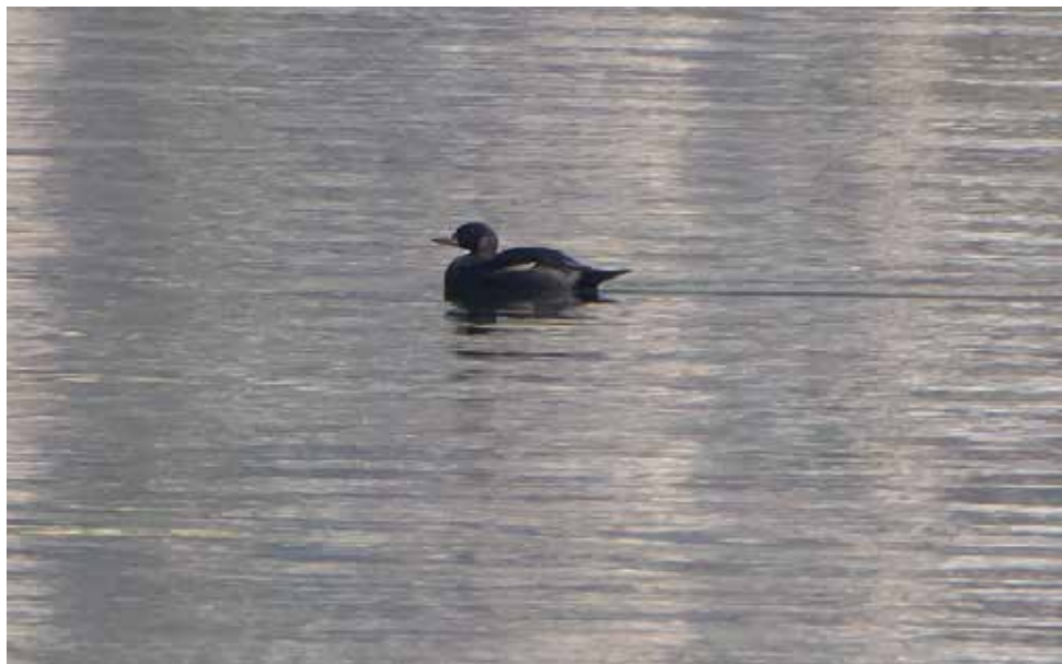
Orchetto marino. Alto Lario (CO-LC).

dal 28 al 29 novembre a Gera Lario (CO) 2 ind (M. Esposito e A. Sala)