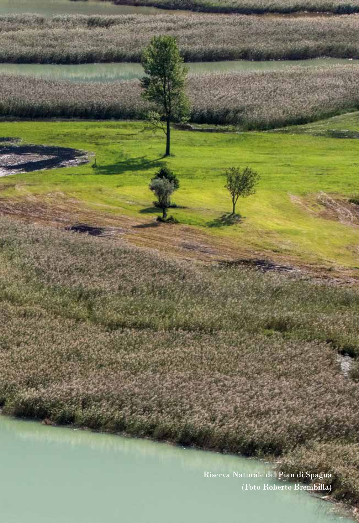
Riserva Naturale del Pian di Spagna