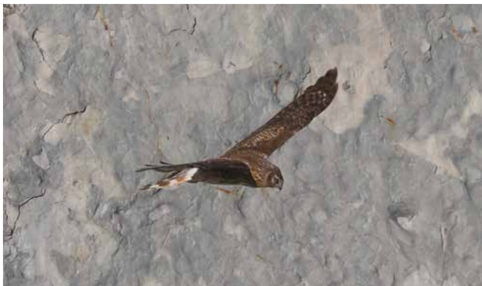
Albanella reale. Cesana Brianza (LC). (Giuseppe Colombo)

17 gennaio a Biassono (MB) 1 ind tipo f (C. Rovelli) 14 aprile a Cogliate (MB) 1 ind (L. Gennari)