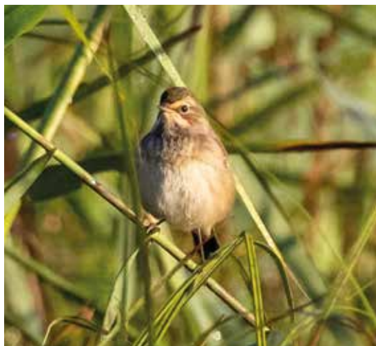
Pettazzurro. Pian di Spagna (CO). (Roberto Brembilla)

dal 2 al 3 ottobre al Pian di Spagna (CO) 2 ind (An. Nava e Al. Nava)