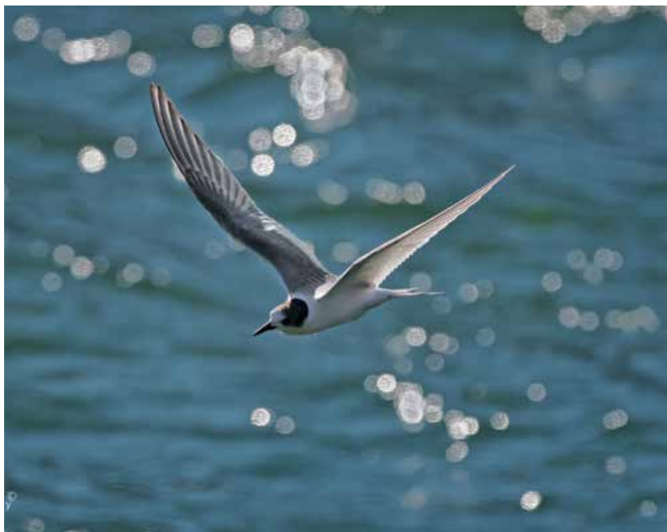
Sterna codalunga. Lago di Olginate (LC). (Mirko Papini)

29 agosto al Lago di Olginate (LC) 1 ind 1cy (M. Papini, P. Bonvicini e G. Redaelli)