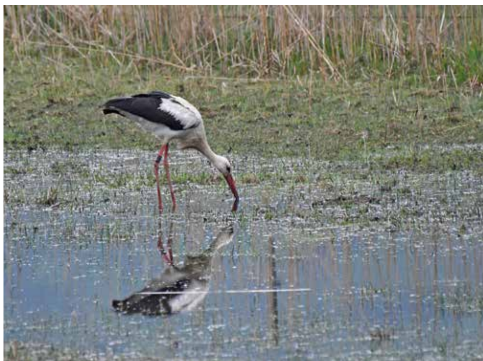
Cicogna bianca. Pian di Spagna (CO). (Alfio Sala)

7 maggio a Fenegrò (CO) 3 ind (W. Sassi e V. Clerici)