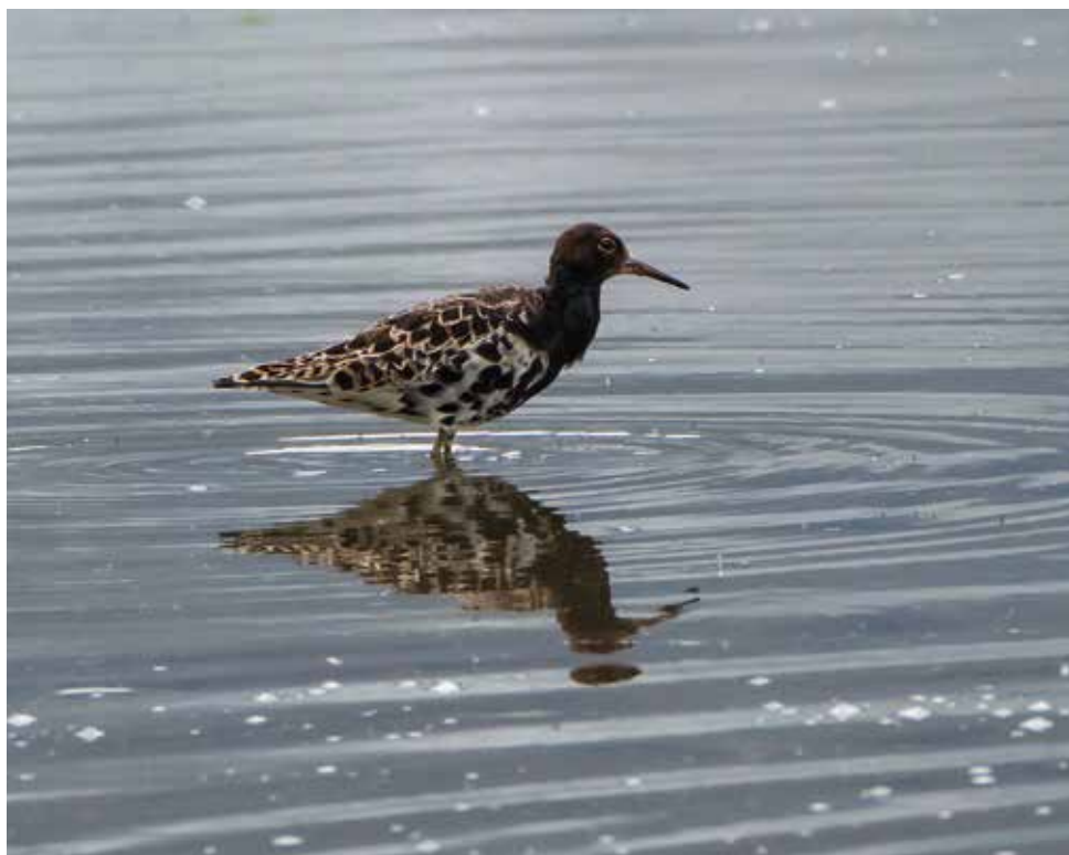
Combattente. Gera Lario (CO). (Giovanni Fontana)

M reg per Como. Accidentale per Lecco, si tratterebbe della nona segnalazione (cfr. BAZZI et al, 2021). 29 aprile alla Punta del Corno, Rogeno (LC) 27 ind (Giu. Colombo e A. Galimberti) dal 30 aprile al 2 maggio tra Gera Lario (CO) e Pian di Spagna (CO) da 1 a 2 ind (An Nava, Al. Nava e A. Sala)