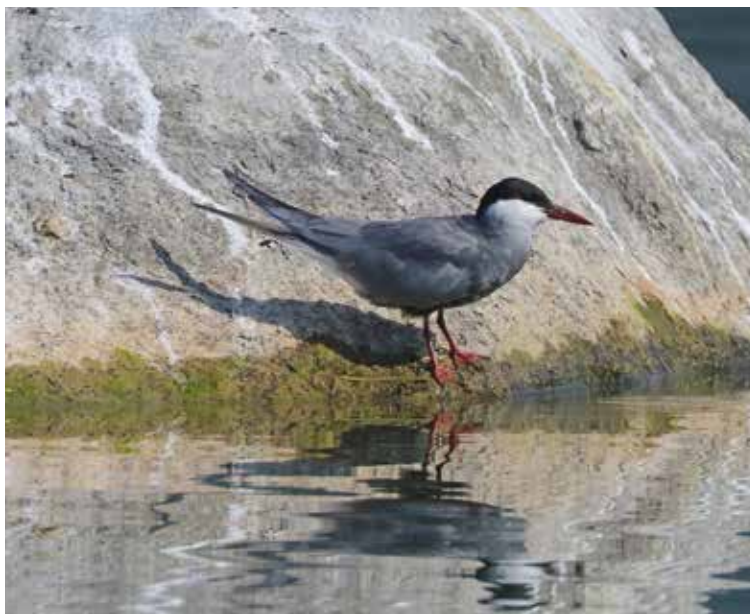
Mignattino piombato. Punta del Corno, Rogeno (LC). (Giuseppe Colombo)

28 giugno alla Punta del Corno, Rogeno (LC) 2 ind (Giu. Colombo)