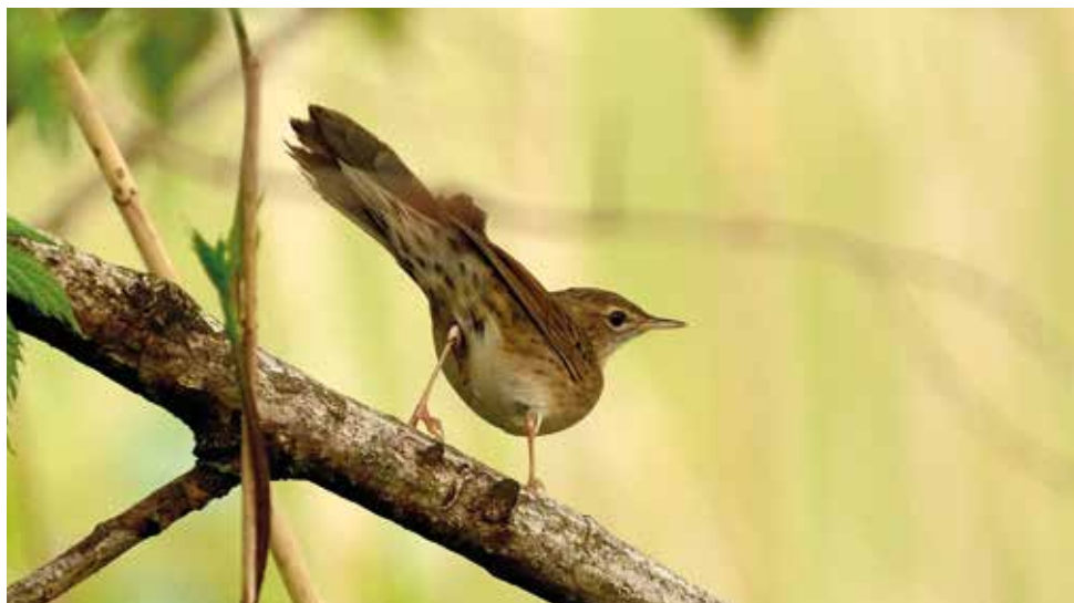
Forapaglie macchiettato. Pian di Spagna (CO). (Luigi Gennari)

2 maggio alla Poncia, Annone - Oggiono (LC) 1 ind (G. Bazzi) 7 maggio a Carimate (CO) 1 ind (M. Brambilla) 7 maggio a Fenegrò (CO) 1 ind (W. Sassi) 7 maggio a Senna Comasco (CO) 1 ind (M. Brambilla) 8 maggio a Cogliate (MB) 1 ind (W. Sassi) 8 maggio a Cucciago (CO) 1 ind (M. Brambilla) 8 maggio a Lentate sul Seveso (MB) 1 ind (W. Sassi) 12 maggio alla Poncia, Annone - Oggiono (LC) 1 ind (P. Bonvicini) 26 maggio all'Oasi del Bassone, Torbiere di Albate (CO) 2 ind (M. Brambilla) 1° giugno a Figino Serenza (CO) 1 ind (M. Brambilla) 3 giugno a Cuggiagio-Senna Comasco (CO) 1 ind (M. Brambilla) 17 luglio al Lago di Annone (LC) 1 ind (W. Sassi) 10 agosto al Lago di Alserio (CO) 1 ind (M. Brambilla) 16 agosto a Lissone (MB) 1 ind (An. Nava) dal 3 al 4 settembre al Lambrone, Erba (CO) 1 ind (F. Ornaghi) 4 settembre al Pian di Spagna (CO) 1 ind (An. Nava e Al. Nava) 6 settembre all'Oasi del Bassone, Torbiere di Albate (CO) 1 ind (G. Gianatti) 11 settembre al Lambrone, Erba (CO) 1 ind (C. Foglini) dall'11 al 17 settembre al Pian di Spagna (CO) da 1 a 2 ind (An. Nava e Al. Nava) 21 settembre al Lambrone, Erba (CO) 1 ind (F. Ornaghi) 29 settembre al Lambrone, Erba (CO) 1 ind (F. Ornaghi)