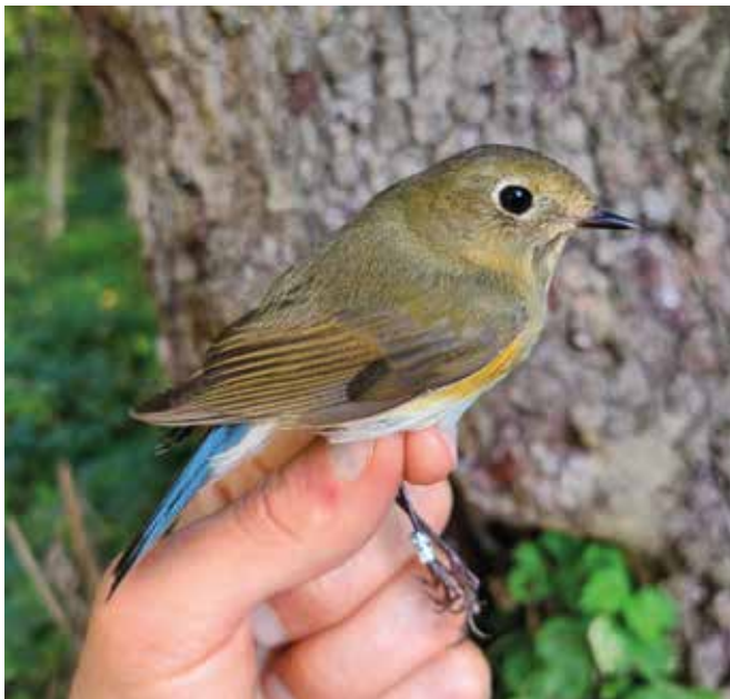
Codazzurro. Lambrone, Erba (CO). (Mattia Panzeri)

22 ottobre al Lambrone, Erba (CO) 1 ind (M. Panzeri)