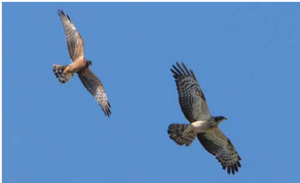
Albanella minore e Falco pecchiaiolo. Monti di Pianello e di Musso (CO).

dal 1° al 2 maggio al Pian di Spagna (CO) 1 m ad (R. Brembilla) 2 maggio a Cermenate (CO) 1 m (W. Sassi) 2 maggio a Fenegrò (CO) 1 m lcy (W. Sassi) 2 maggio a Limido Comasco (CO) 3 ind (2 m e 1 f) (N. Larroux) 2 maggio a Turate (CO) 5 ind (3 m e 2 f) (N. Larroux) 3 maggio a Casatenovo (LC) 1 ind (A. Sala) 3 maggio a Locate Varesino (CO) 2 ind (N. Larroux) dal 10 al 13 maggio al Pian di Spagna (CO) 2 ind (G. Fontana) 12 maggio alla Poncia, Annone - Oggiono (LC) 1 f (P. Bonvicini) dal 19 al 25 agosto ai Monti di Pianello e di Musso (CO) 1 ind lcy (G. Fontana) 21 agosto a Brivio (LC) 1 ind (G. Radaelli)