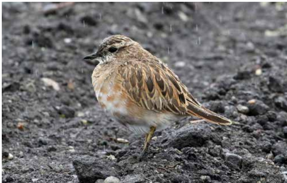
Piviere tortolino. Poncia, Annone - Oggiono (LC). (Enrico Viganò)

Accidentale per le province di Como e di Lecco: si tratterebbero rispettivamente della sesta e della quinta segnalazione (cfr. BAZZI et al, 2021). Per Monza e Brianza si tratterebbero della prima e della seconda osservazione e la specie è da considerare come accidentale. della 12 aprile alla Poncia, Annone - Oggiono (LC) 1 ind (E. Viganò) 13 aprile a Cogliate (MB) 1 ind (M. Brambilla) 24 aprile a Solaro (MB) 1 ind (M. Barattieri) 2 settembre al Monte San Primo (CO) 1 ind (M. Urban)