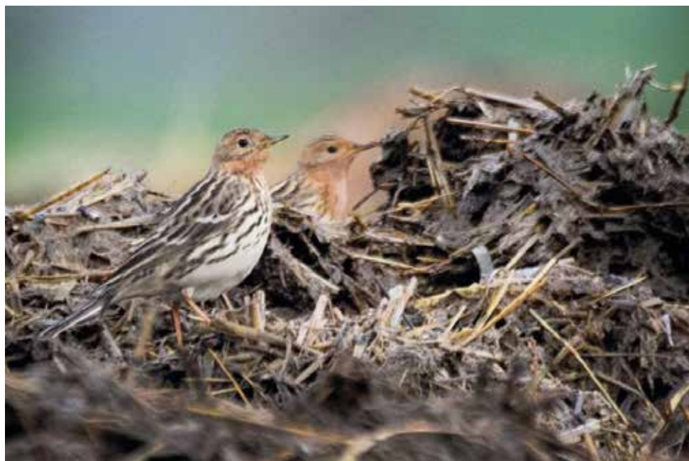
Pispola golarossa. Delebio (LC). (Giovanni Mauro Ferrari)

9 ottobre al Pian di Spagna (CO) 1 ind (An. Nava et al.)