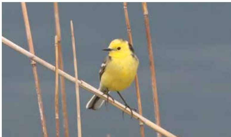
Cutrettola testagiàlla orientale. Rogeno (LC). (Giuseppe Colombo)

dal 1° al 2 maggio alla Punta del Corno, Rogeno (LC) 1 ind (Giu. Colombo e A. Galimberti)