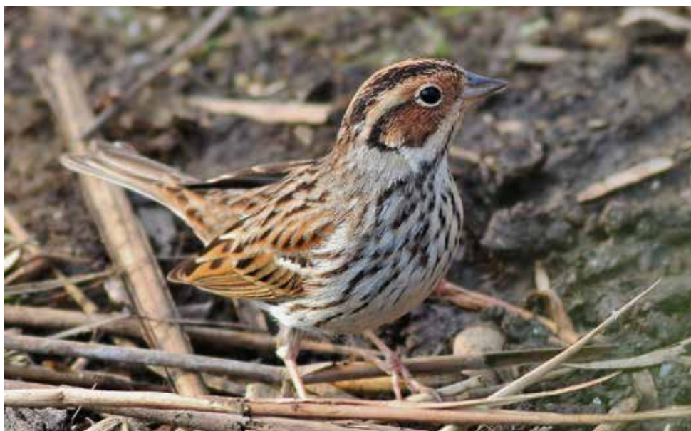
Zigolo minore. Alserio - Erba (CO). (Angelo Sebastianelli)

15 aprile tra Lago di Alserio (CO) e il Lambrone, Erba (CO) 1 ind (A. Sebastianelli)