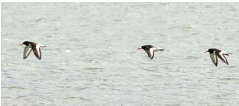
Beccaccia di mare. Gera Lario (CO). (Claudio Foglini)

22 maggio a Ceriano Laghetto (MB) 2 ind (M. Monfrini)