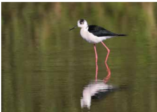
Cavaliere d'Italia. Foce Adda (CO-LC). (Angelo Sebastianelli)

12 maggio a foce Adda (CO-LC) 1 ind (A. Sebastianelli)