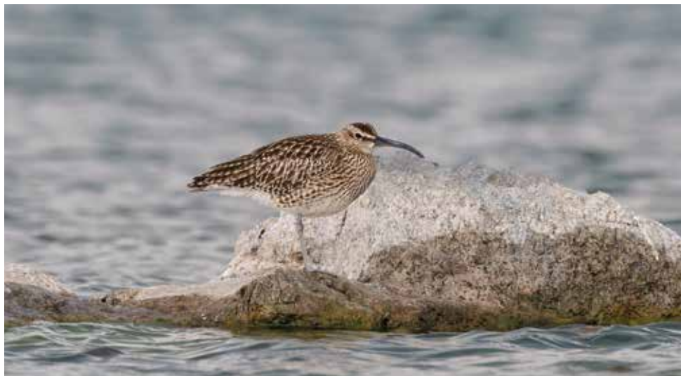
Chiurlo piccolo. Punta del Corno, Rogeno (LC). (Mirko Papini)

26 aprile alla Punta del Corno, Rogeno (LC) 1 ind (E. Viganò)