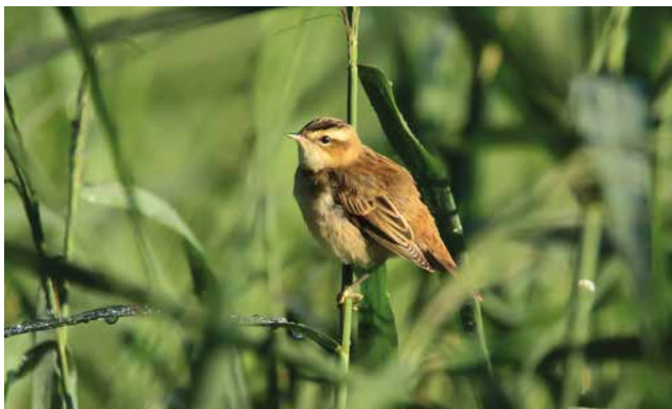
Forapaglie comune. Pian di Spagna (CO). (Marco Esposito)

1° maggio all'Oasi del Bassone, Torbiere di Albate (CO) 12 ind (M. Brambilla)