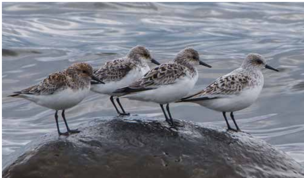
Piovanello tridattilo. Gravedona (CO). (Giovanni Fontana)

27 aprile a Gravedona (CO) 4 ind (G. Fontana, M. Esposito e R. Brembilla)