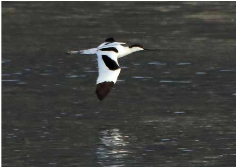
Avocetta. Foce Adda (CO-LC). (Marco Esposito)

7 aprile a Foce Adda (CO-LC) 1 ind (M. Esposito)