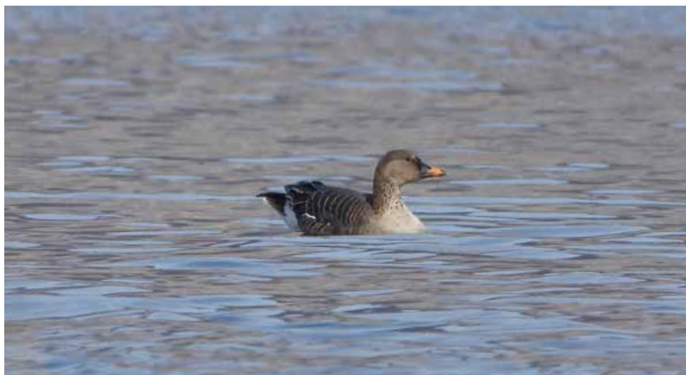
Oca granaiola. Rogeno (LC). (Alberto Cavenaghi)

15 febbraio alla Punta del Corno, Rogeno (LC) 1 ind (A. Cavenaghi)