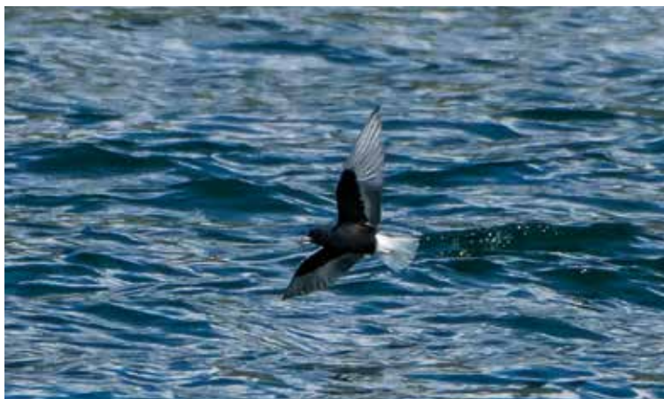
Mignattino alibianche. Foce Adda (CO-LC). (Giovanni Fontana)

dal 19 al 21 settembre al Lago di Pusiano (CO-LC) 2 ind (P. Bonvicini, G. Bazzi e Li. Bazzi)