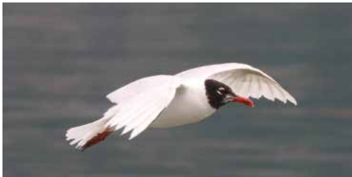
Gabbiano corallino. Punta del Corno, Rogeno (LC). (Giuseppe Colombo)

23 agosto a Domaso (CO) 1 juv (C. Crespi)