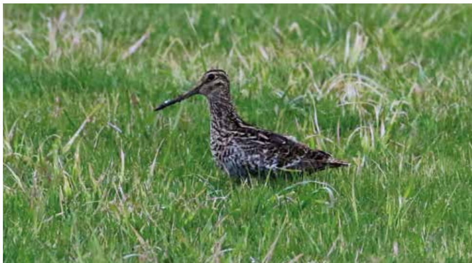
Croccolone. Poncia, Annone - Oggiono (LC). (Enrico Viganò)