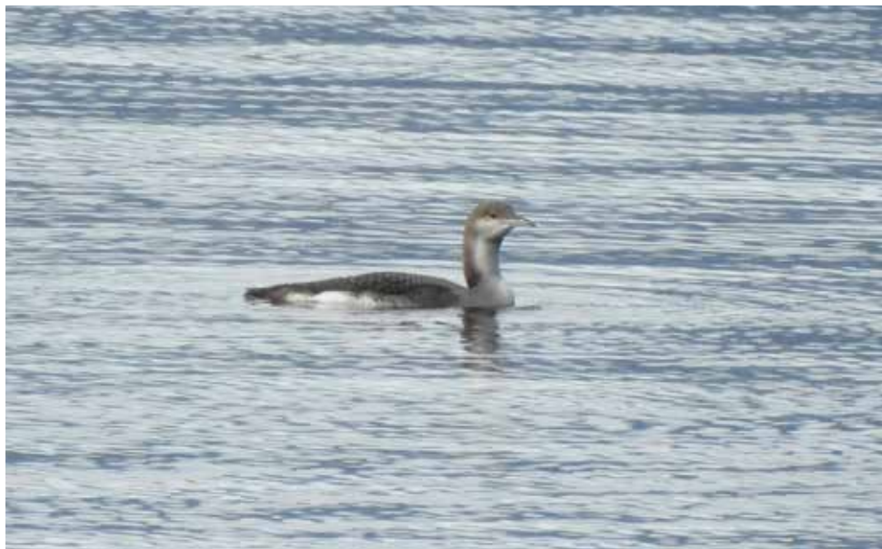
Strolaga mezzana. Mandello del Lario (LC). (Lionello Bazzi)

4 gennaio a Olcio, Mandello del Lario (LC) 1 ind (Li. Bazzi e G. Bazzi)