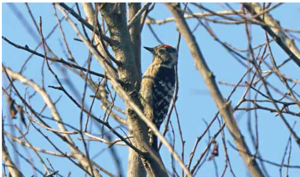
Picchio rosso minore. Annone - Oggiono (LC). (Giuseppe Colombo)

30 ottobre a Carimate (CO) 1 ind (W. Sassi)