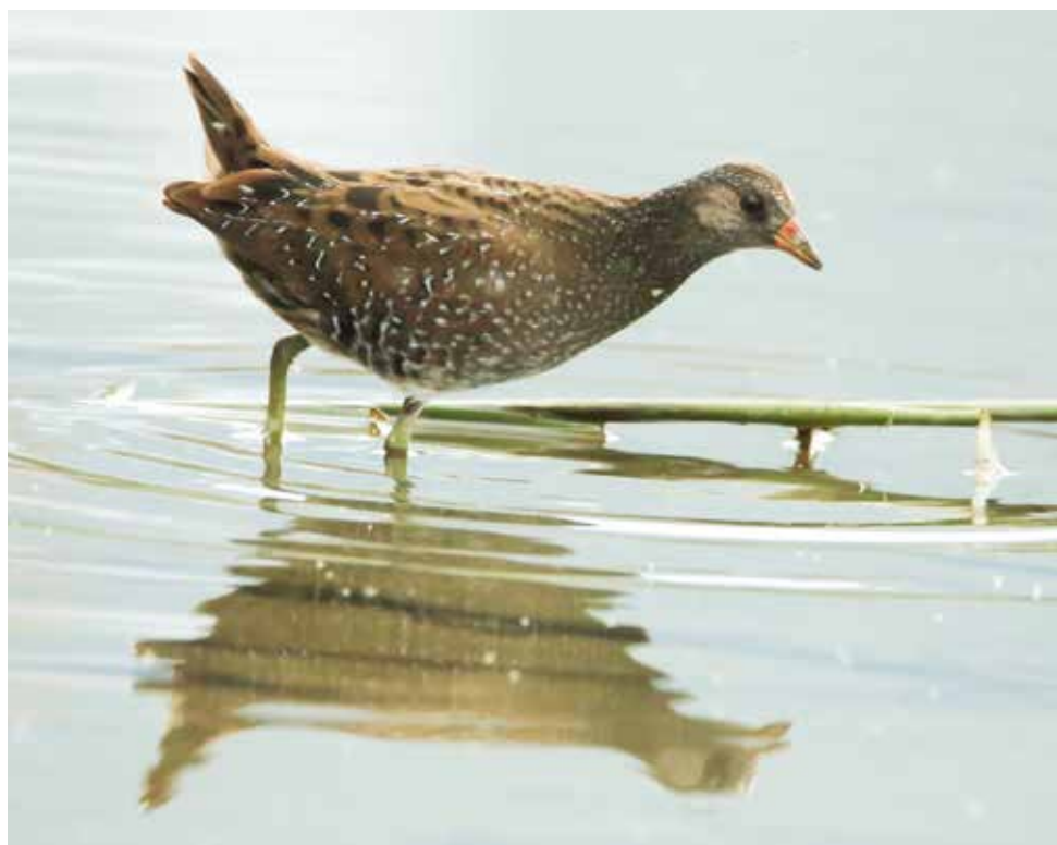
Voltolino. Gera Lario (CO). (Marco Esposito)

22 ottobre all'Oasi del Bassone, Torbiere di Albate (CO) 2 ind (M. Brambilla)