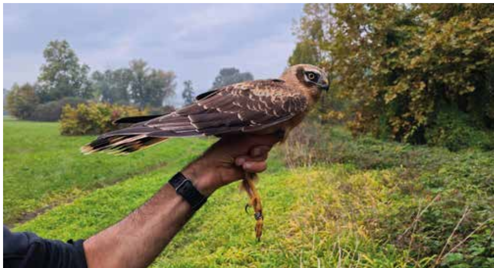
Albanella pallida. Lambrone, Erba (CO). (Mattia Panzeri e Riccardo Rossi)

20 ottobre al Lambrone, Erba (CO) 1 m 1cy (M. Panzeri e R. Rossi)