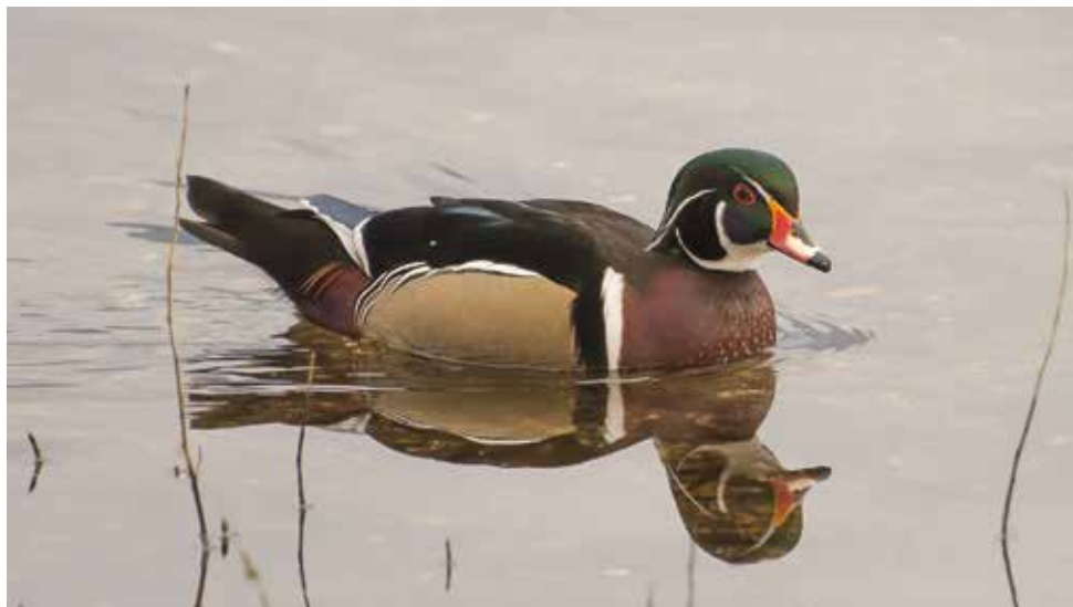
Anatra sposa. Gera Lario (CO). (Giovanni Fontana)

dal 10 al 18 dicembre a Dongo (CO) 2 ind (G. Fontana)