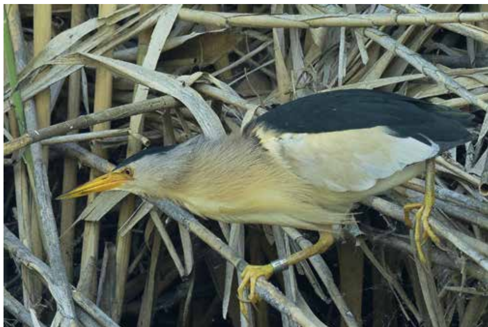
Tarabusino. Lago di Sartirana (LC). (Guido Cima)

25 giugno al Lago di Sartirana (LC) 1 ind con anello TL6672, inanellato nel 2017 a Sartirana, era rimasto appeso ad un amo da pesca abbandonato nel canneto e venne recuperato dagli agenti della Polizia Provinciale; osservato anche nel 2019 (G. Cima)