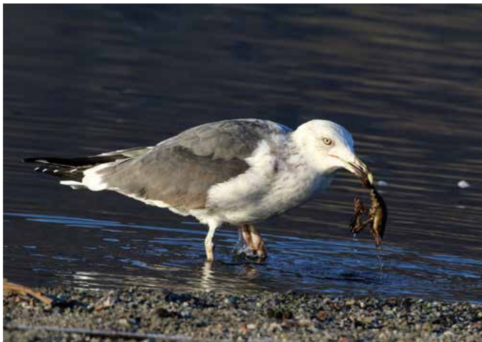
Zafferano. Lago di Olginate (LC). (Enrico Viganò)

4 gennaio al Lago di Olginate (LC) 1 ind 4cy (E. Viganò) dall'8 febbraio al 5 marzo al Lago di Olginate (LC) 1 ind 4cy (Ma. Brambilla) 28 febbraio al Lago di Annone (LC) 1 ind (C. Foglini) 19 luglio alla Punta del Corno, Rogeno (LC) 1 ind (Giu. Colombo)