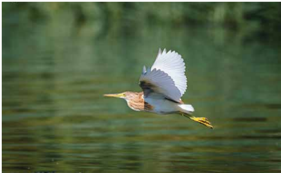
Sgarza ciuffetto. Lago di Olginate (LC). (Mirko Papini)

29 agosto al Lago di Annone (LC) 1 ind (A. Corti)