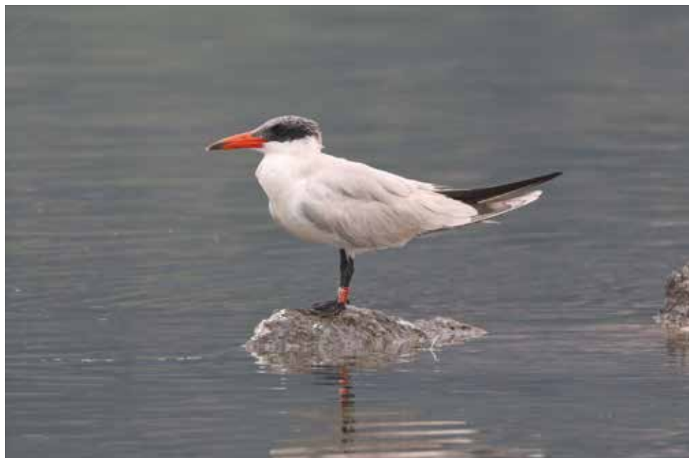
Sterna maggiore. Punta del Corno, Rogeno (LC). (Giuseppe Colombo)

dal 28 luglio al 1° agosto al Lago di Pusiano (CO-LC) 1 ind con anello rosso con scritta bianca AF05, inanellato in Svezia (Giu. Colombo)