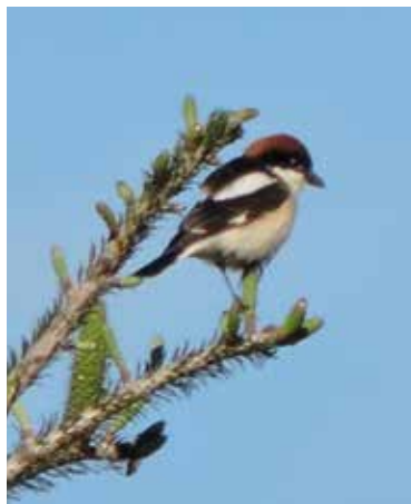
Averla capirossa. Lissone (MB).

3 giugno al Pian di Spagna (CO) 1 ind (G. Fontana)