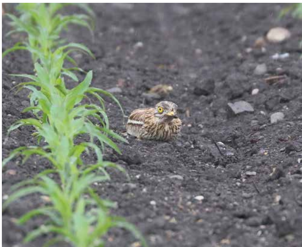
Occhione. Poncia, Annone - Oggiono (LC). (Giuseppe Colombo)

Accidentale per Lecco: si tratterebbe della terza segnalazione (cfr. BAZZI et al, 2021). dall'11 al 12 maggio alla Poncia, Annone - Oggiono (LC) 1 ind (Giu. Colombo)