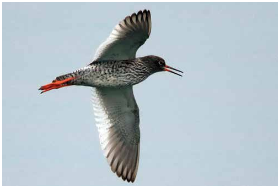
Pettegola. Colico (LC). (Marco Esposito)

dal 18 al 21 luglio ai Prati del Ceppo, Lomazzo (CO) 1 ind (V. Clerici)