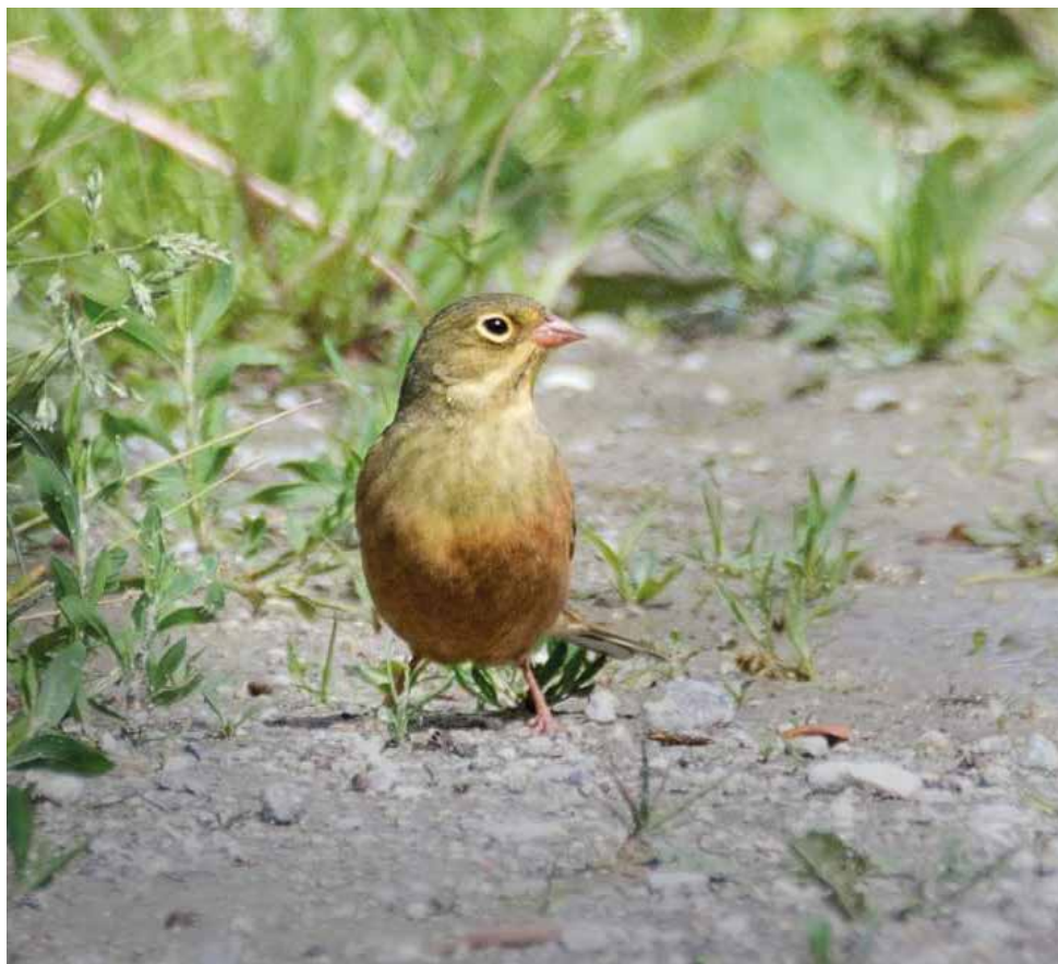
Ortolano. Pian di Spagna (CO-LC). (Giovanni Mauro Ferrari)

19 giugno all'Alpe Giumello (LC) 1 ind (P. Bonvicini)