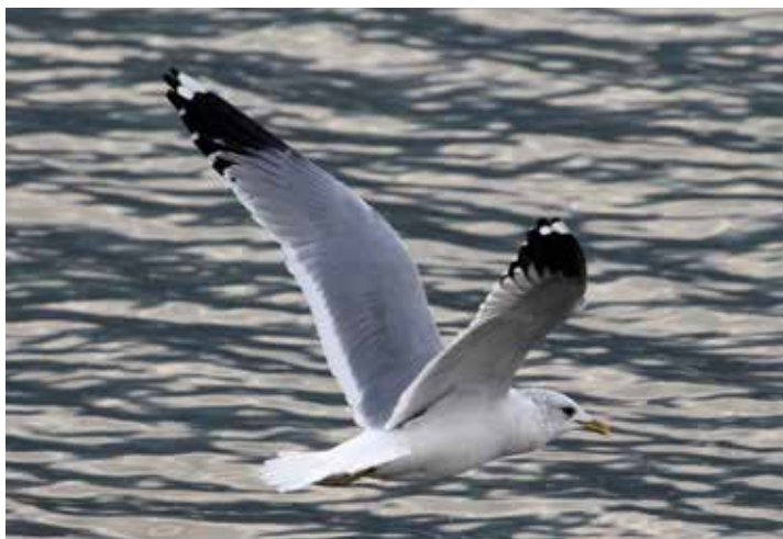
Gavina siberiana. Abbazia Lariana (LC). (Enrico Viganò)

dal 3 al 19 dicembre ad Abbazia Lariana (LC) 1 ind (Li. Bazzi)