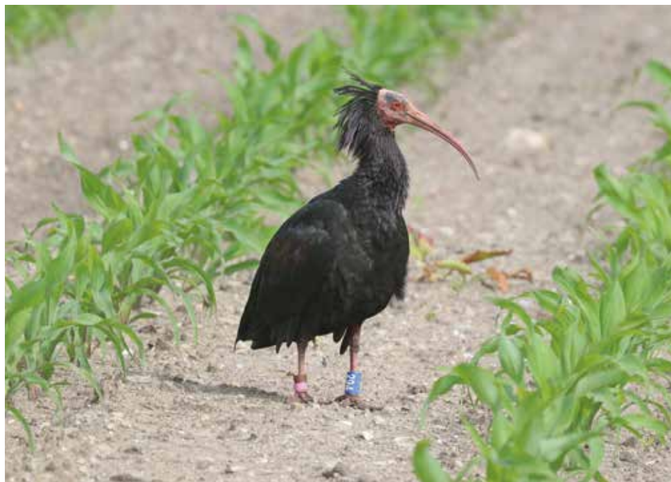
Ibis eremita. Annone - Oggiono (LC). (Giuseppe Colombo)

5 giugno a Samolaco (SO) 3 ind (R. Roganti)