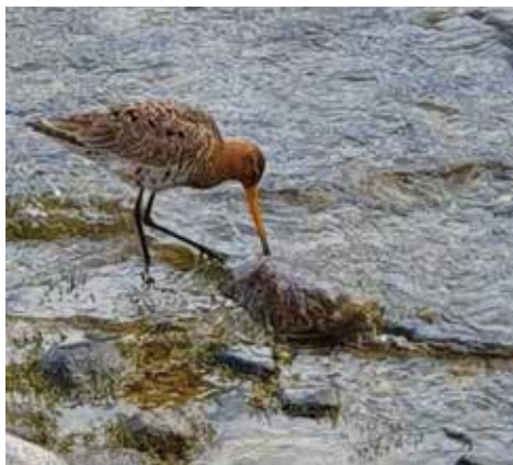
Pittima reale. Gravedona (CO). (Marco Testa)

dal 22 al 26 aprile a Gravedona (CO) 1 ind che debilitato, morirà il 26 aprile (M. Testa)